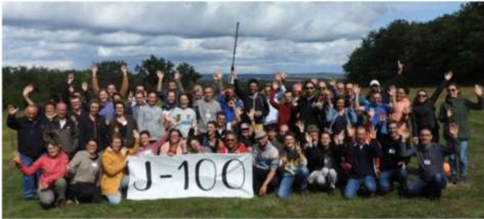
Les Rencontres régionales des adhérents AURA en septembre 2023 dans l'Allier

LE RÉSEAU RÉGIONAL A ÉTÉ CRÉÉ EN 2013, ET A BÉNÉFICIÉ DÈS LE LANCEMENT DU SOUTIEN FINANCIER ET TECHNIQUE DE L'ADEME ET DE LA RÉGION