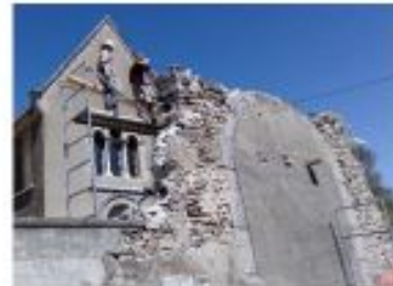
Porche du château de Beaumont La Mure d'Isère