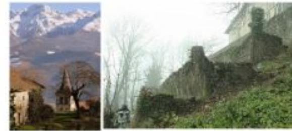
Cure de Biviers 4 terrasses à restaurer