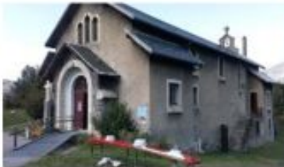
Chapelle N.D. des Neiges Susville - Isère