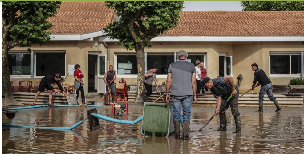
Inondation école maternelle Tresse (33) après un orage