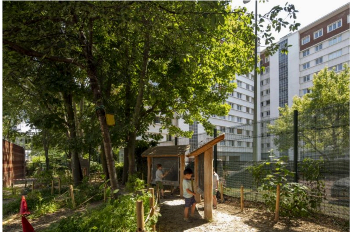
Dans la cour de l'école maternelle Jean-Dolent, dans le 14 e arrondissement de Paris, en juillet 2021.

Paris expérimente l'ouverture de cours d'école en période de canicule