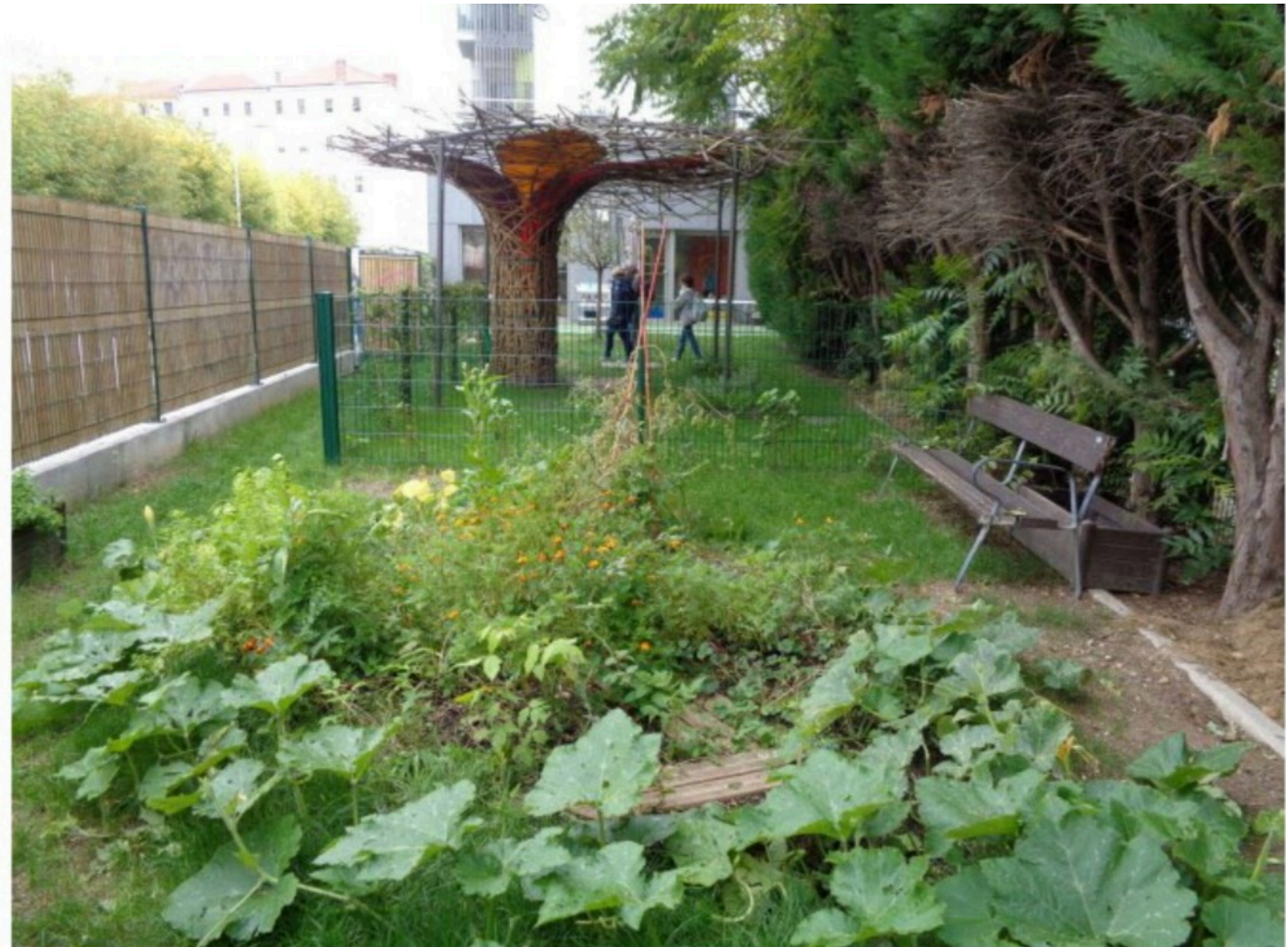
Un "arbre de pluie" domine une pelouse verdoyante. Courgettes, tomates, fraises, basilic, menthe et lavande poussent désormais sous les yeux des enfants.