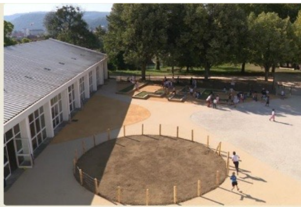
La nouvelle cour de l'école Brossolette à Besançon.