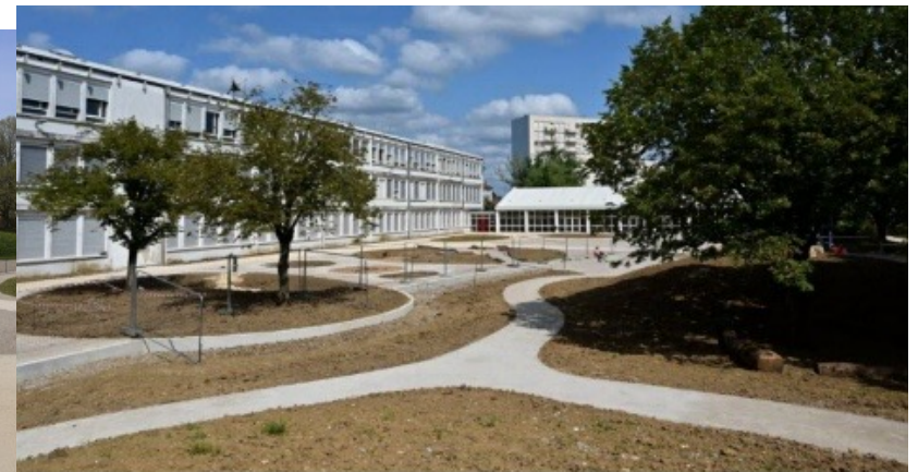
Une école ouverte pour la communauté de l'école Brossolette à Besançon : arbres, haies, jeux et plantations.