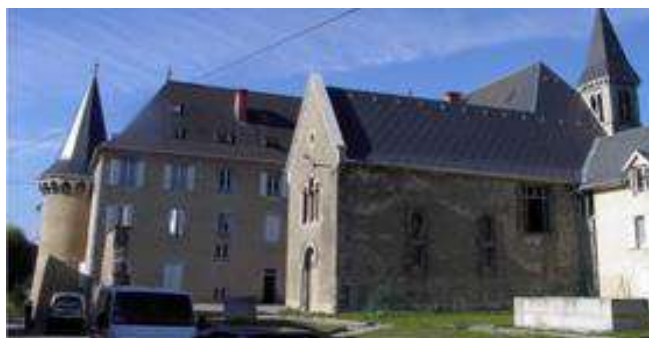
Chapelle N.D. des Neiges Susville - Isère